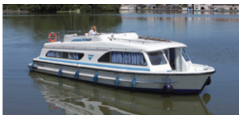
Salsa A :