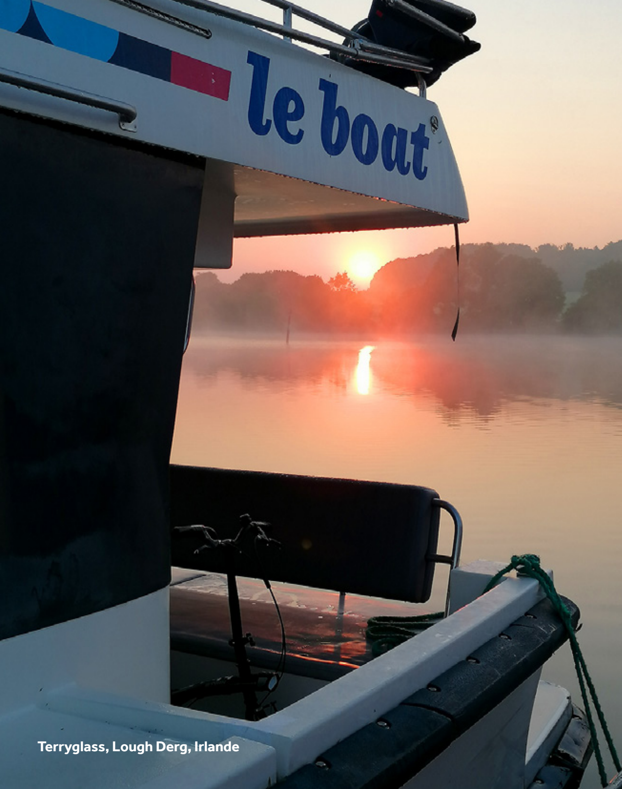
Terryglass, Lough Derg, Irlande