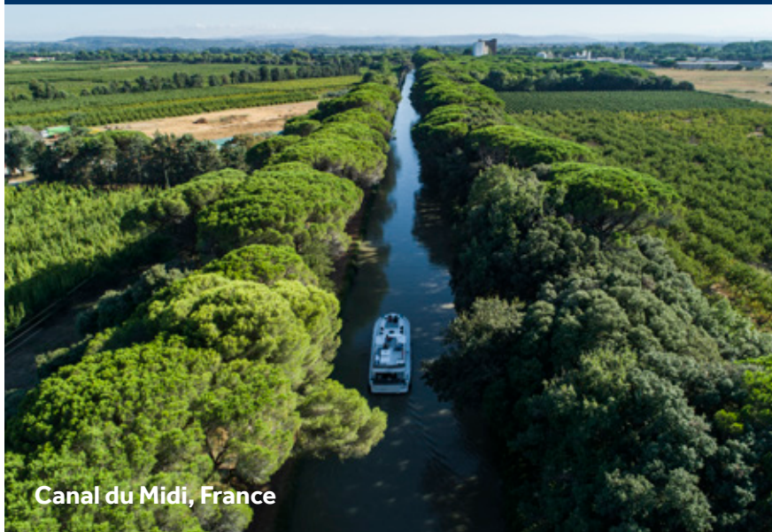
Canal du Midi, France

« Des vacances en bateau en France sont un moyen idéal pour profiter du paysage spectaculaire des voies navigables françaises. Découvrez la beauté de la France et de ses paysages depuis les canaux et les rivières du pays. »