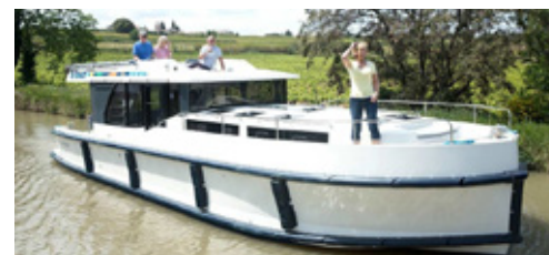
Horizon 3 :